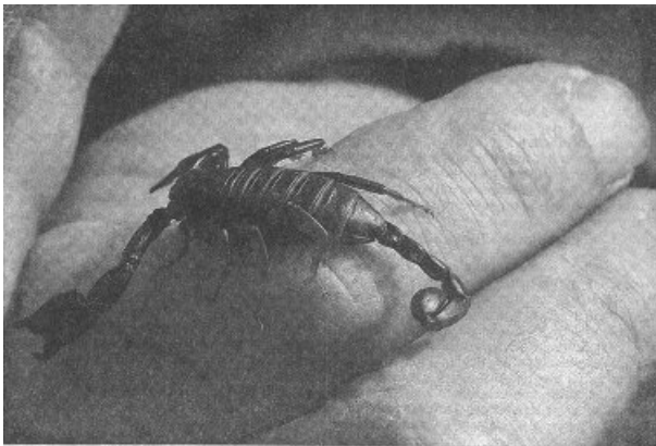
Ein männlicher Euscorpium italicus – gefunden bei Arzo im Südtessin.